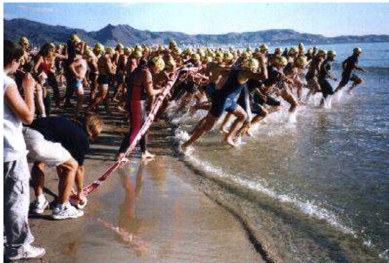
Salida del I Triatlón de Castellón 2002