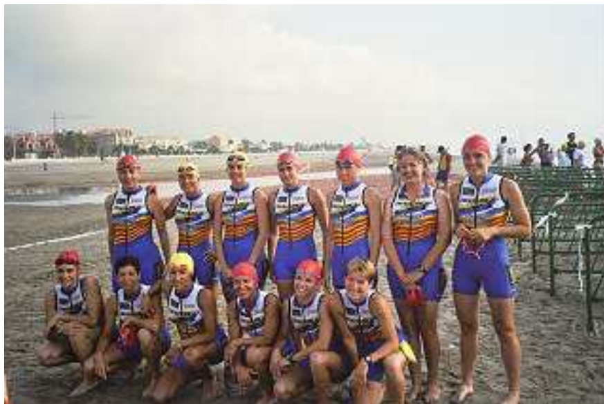
Foto de la selección femenina de la C. Valenciana en la Playa del Pinar de Castellón, poco antes del Cpto. de España por Automías 2003

Pero llegaría el nuevo proyecto, que sería el Cpto. de España por Autonomías que se celebró finalmente los días 5 y 6 de julio de 2003 . En la memoria adjunta se detallan los elementos más destacados de esta prueba.