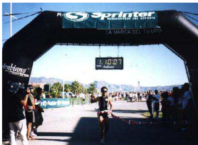
Foto del Ganador del I Triatlón de Castellón 2002