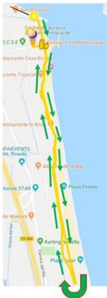
Giro a meta