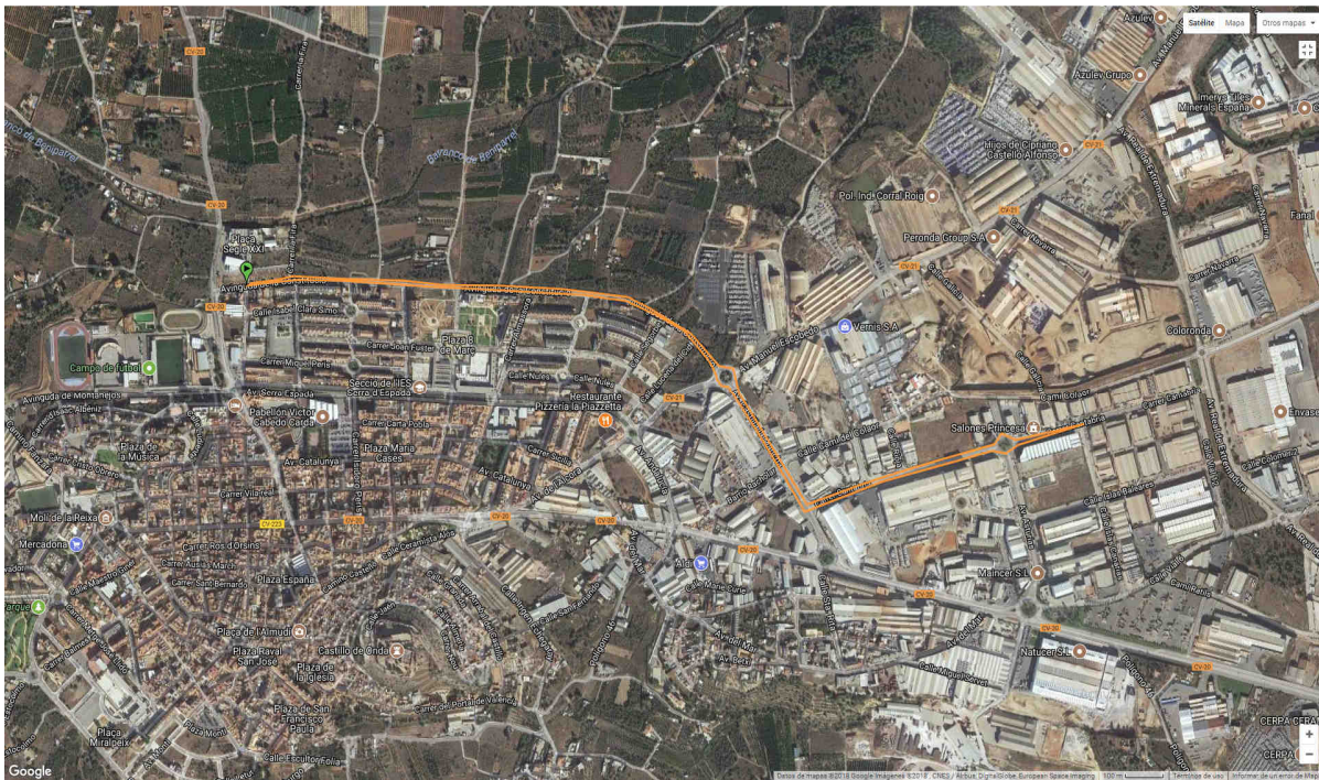
Carrera a pie- 3er Tramo : 1 Vuelta a un circuito de 2.5 km.