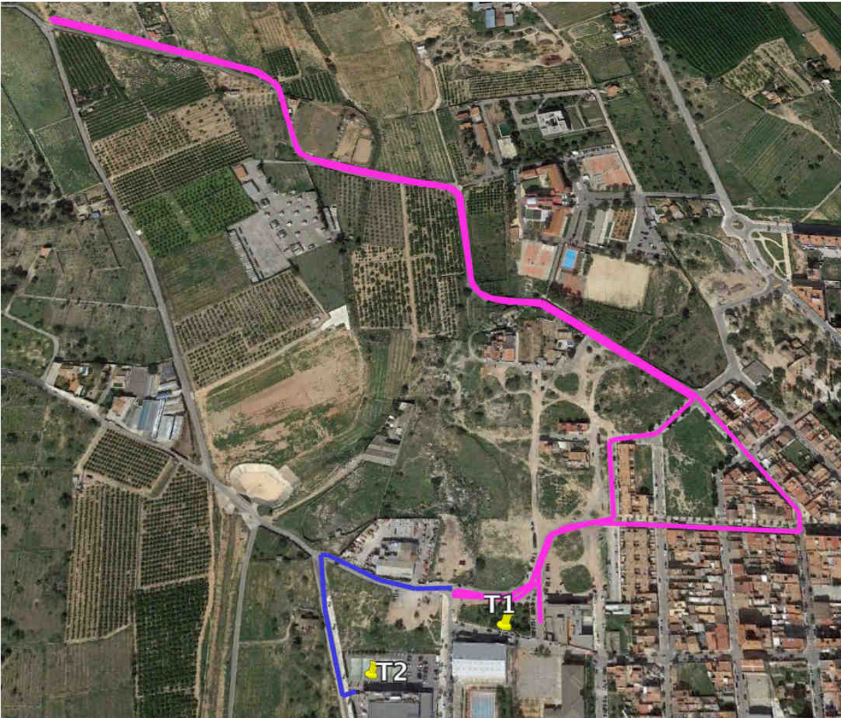
CIRCUITO BICICLETA ALEVINES (1 VUELTA) línea azul enlace con T2 en la última vuelta