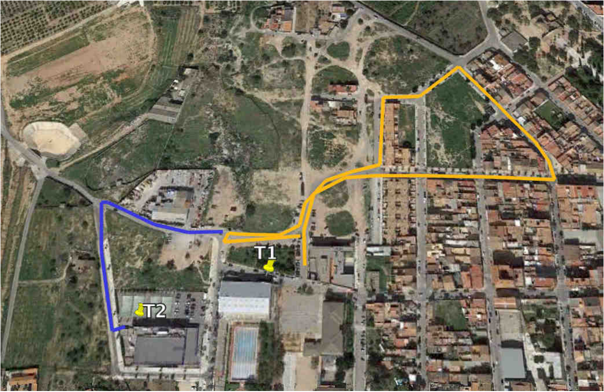
CIRCUITO CARRERA A PIE BENJAMINES (1 vuelta)