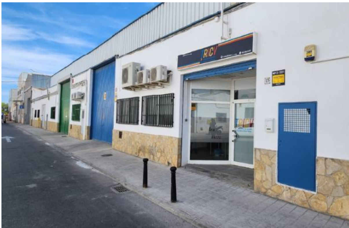
(zona almacén y detalle de la fachada con la imagen de la Federación)